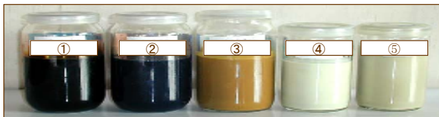
① JIS1号 クレオソート油 ② 脱発ガン性クレオソート油 ③ EMC-3000 ④ EMC-2000 ⑤ EMC-1000