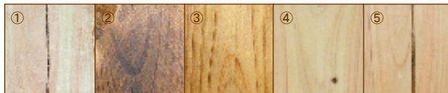
① ブランク (未塗工) ② JIS1号 クレオソート油 ③ EMC-3000 ④ EMC-2000 ⑤ EMC-1000